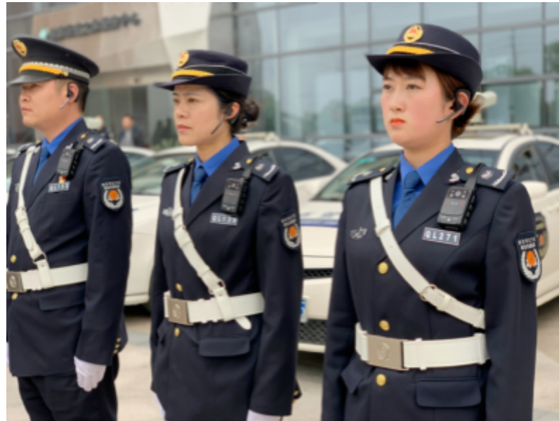
中国东部南京市的城管。

其次，东突厥斯坦的特殊性在于，新疆生产建设兵团(XPCC: Xinjiang Production Construction and Corps)自己的人民警察部队在2018年的改革中由机动支队级