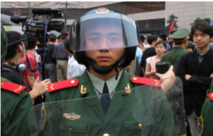
一张未注明日期的照片中的人民警察。他右臂上的徽章写着“内卫部队”，表明他隶属于“内卫部队”，右胸前口袋上方的徽章写着“广东 CAPF”，可能是“广东中国武装警察部队”的意思。

人民武装警察的“内卫部队”(ISC)是在发生内乱时部署的部队。内卫部队由中华人民共和国每个省级行政区(包括东突厥斯坦)内的一个“省级特遣队”组成；每个省级特遣队由一个或多个“机动支队”组成，在组织和指挥结构上类似于一个军团。