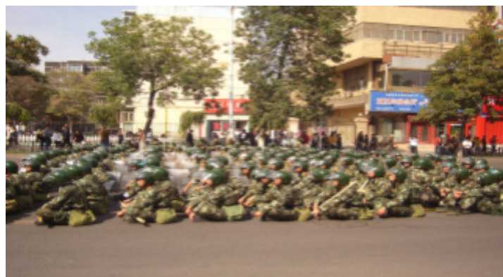
2019 年 9 月，身着防暴装备的人民警察在乌鲁木齐（Ürümchi）。

特警的人群控制职责与人民武装警察的人群控制职责有何重叠之处，目前尚未公开。据目击者报告，在 2009 年 7