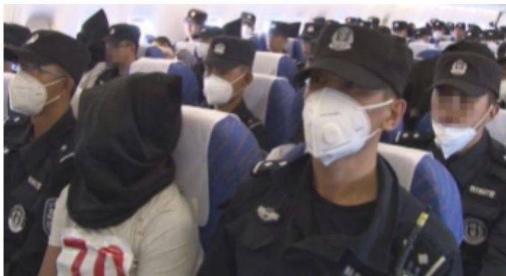
来自中国官方媒体的图片，2015 年 7 月 9 日从泰国飞往中国的航班上，维吾尔族难民每人坐在两名中国“特警”（人民警察中的一支特警部队）成员中间。

送回中国的维吾尔族难民。在中国官方媒体发布的一张图片中，可以看到一些难民头戴黑色头套，身穿编号围兜，坐在两名身着制服的特警中间。允许中国警察在泰国开展行动的外交机制的确切性质尚不得而知；不过，公安部已与许多其他国家就警务问题达成了双边协议。