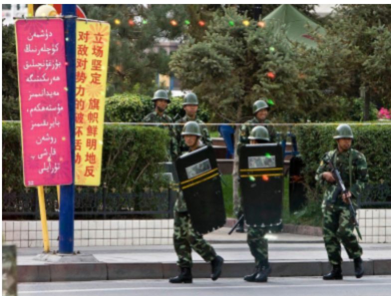
2009 年 9 月，乌鲁木齐的人民警察身着全套军装，手持防暴盾牌，至少有一名警察的步枪装有刺刀。

这项措施的主要成果是，地方政府不能再单方面调动人民武装警察，此举是为了防止地方政府利用人民武装警察唆使腐败，同时也是为了遏制对人民武装警察进行高压部署的情况。